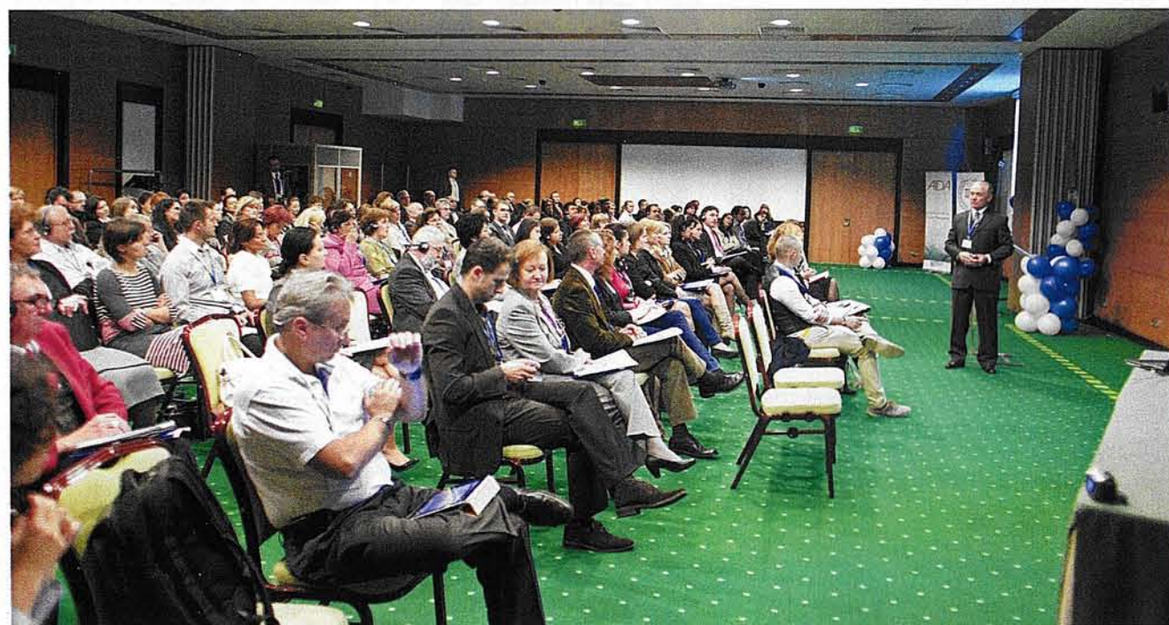
La Conferința Internațională HR de la Brașov, concluzia participanților a fost că investiția în resurse umane este cea mai bună acțiune a unei companii în vremuri incerte